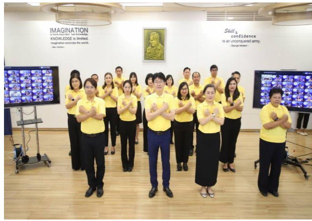
การประกาศเจตจำนงสุจริตต่อต้านการทุจริต No Gift Policy ของคณะผู้บริหารสถาบันคุณวุฒิวิชาชีพ