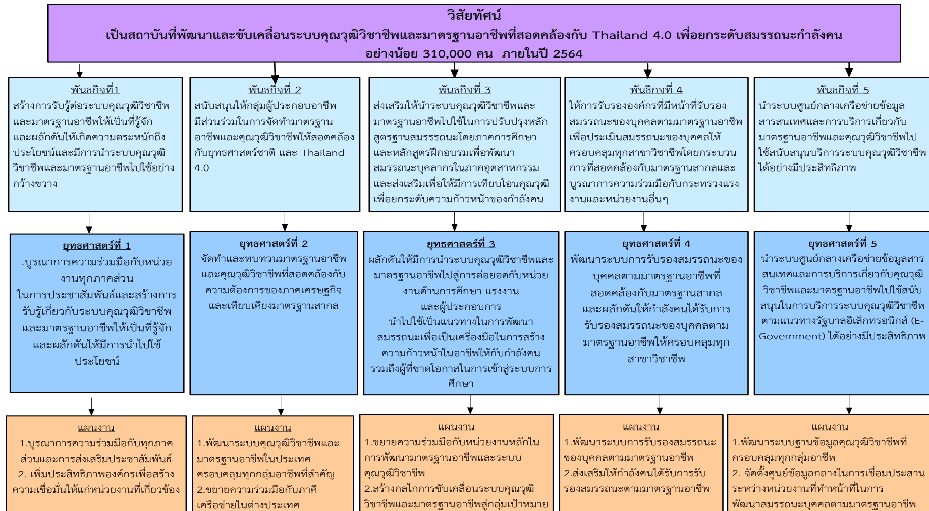
แผนภาพที่ 5.1 ความสอดคล้องระหว่างวิสัยทัศน์ พันธกิจ วัตถุประสงค์หลัก ยุทธศาสตร์ และแผนงานของแผนยุทธศาสตร์สถาบันคุณวุฒิวิชาชีพ พ.ศ. 2560 - 2564